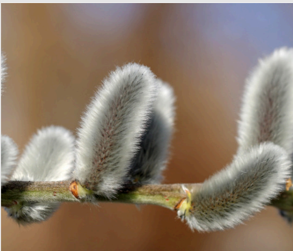
Серезка вербы (ивы) ( Salix spec. )

Семейство ивовых ( Salicaceae ) относится к семейству двудомных растений, в которое входят не только ивы ( Salix spec. ), но и тополи ( Populus spec. ). Как мужские, так и женские цветки ивы образуют соцветия, называемые серезками. Ивы часто встречаются на влажных почвах. Их часто высаживают на склонах, берегах ручьев и рек, так как они закрепляют почву своими корнями. Пчеловоды также сажают ивы возле своих ульев.